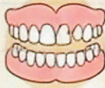
義歯の不調や破損